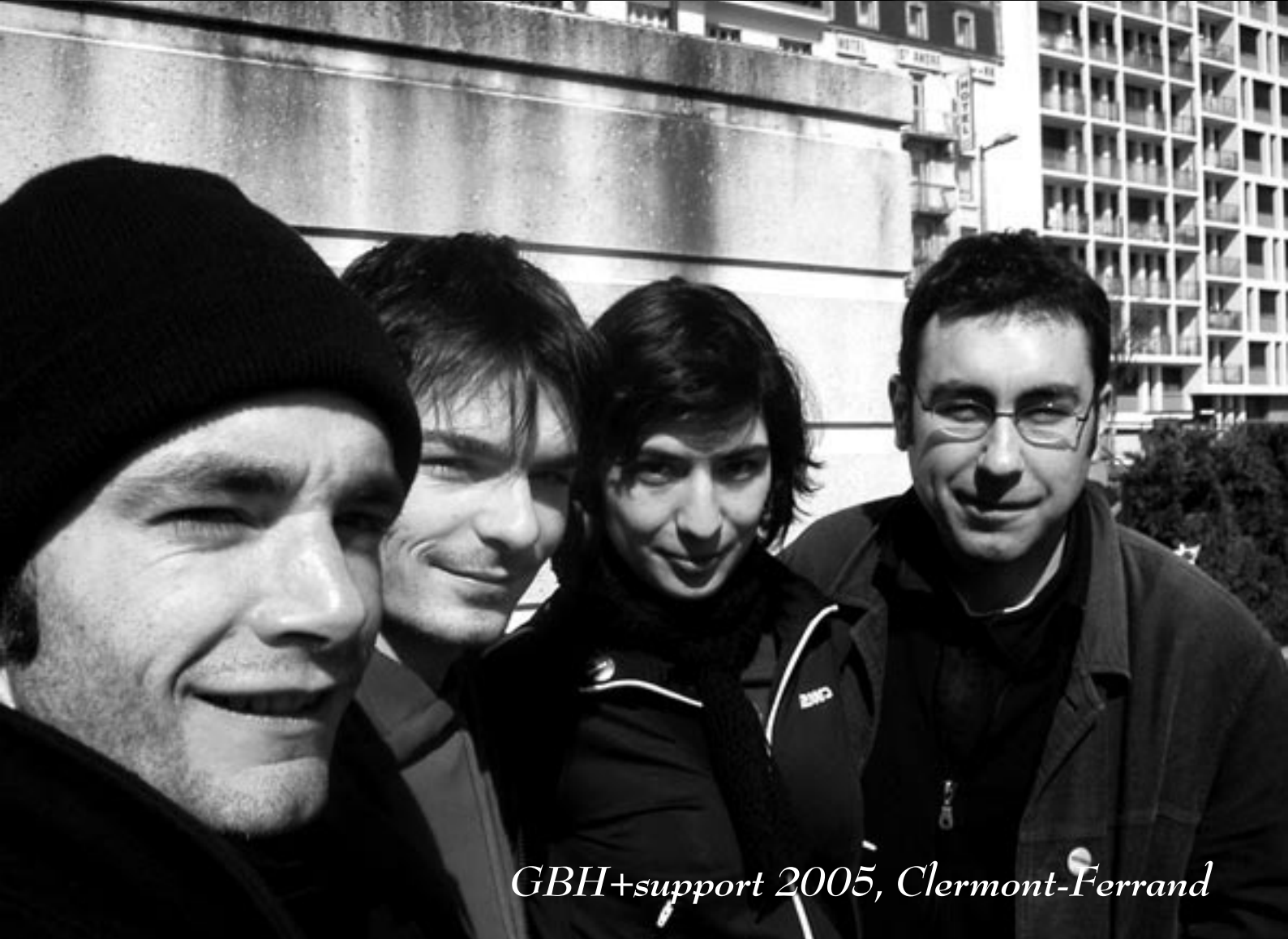
GBH+support 2005, Clermont-Ferrand