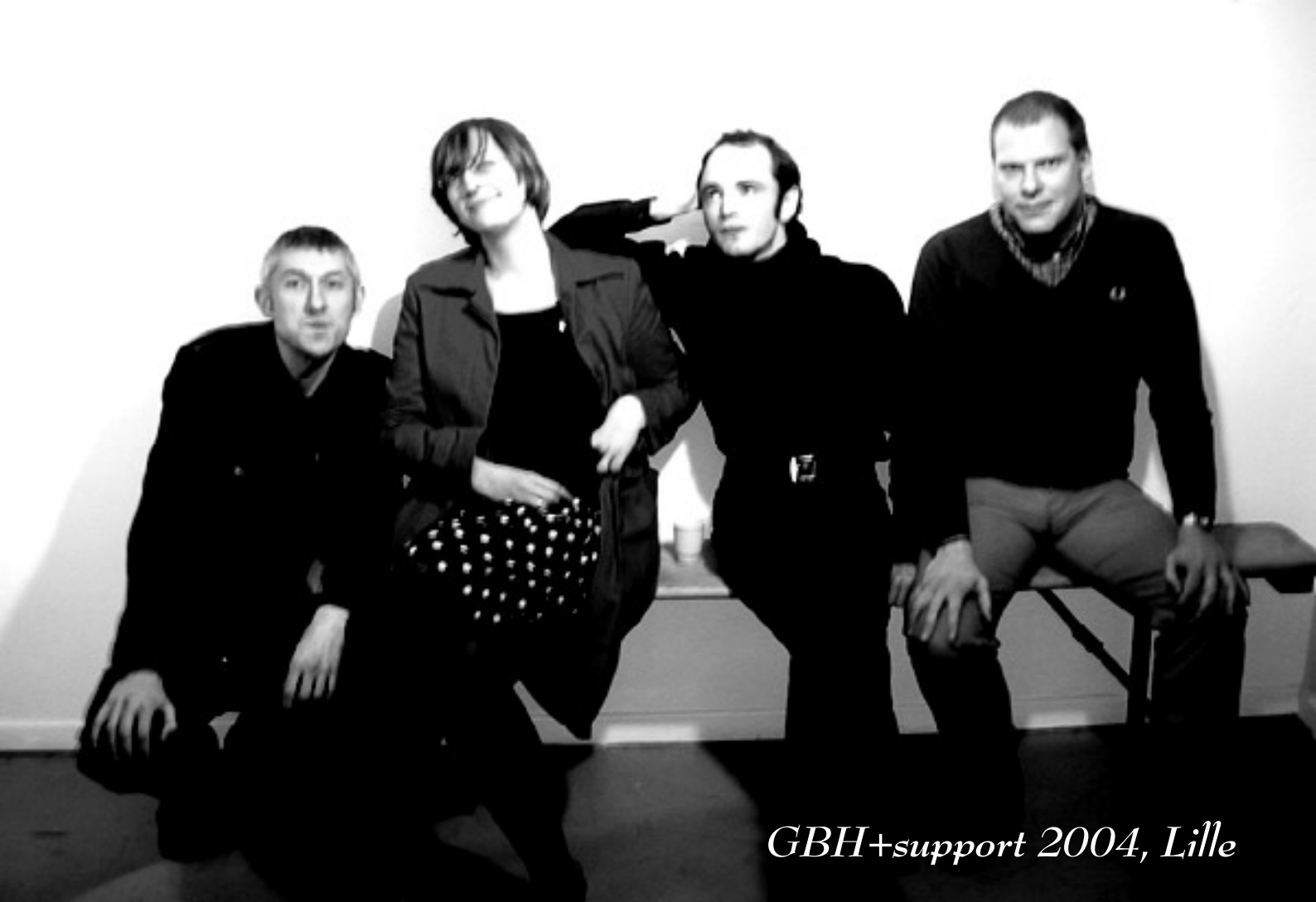
GBH+support 2004, Lille