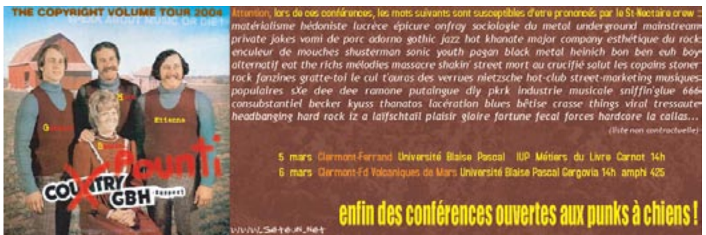
Bandeau publicitaire conçu pour le magazine Kick Ass n° 5