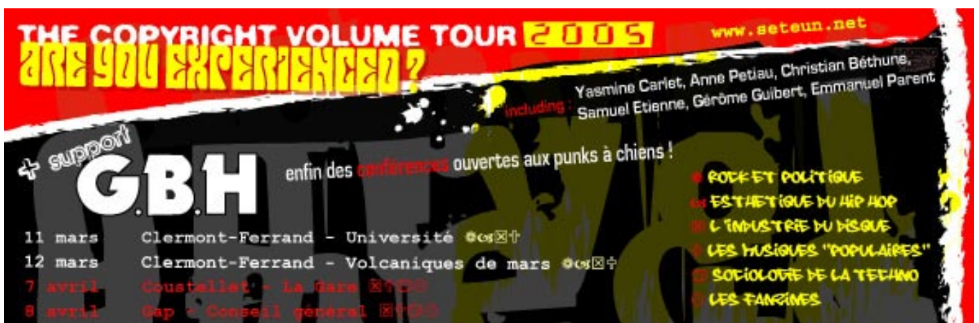
Bandeau publicitaire diffus  par e-mail (1500 contacts)