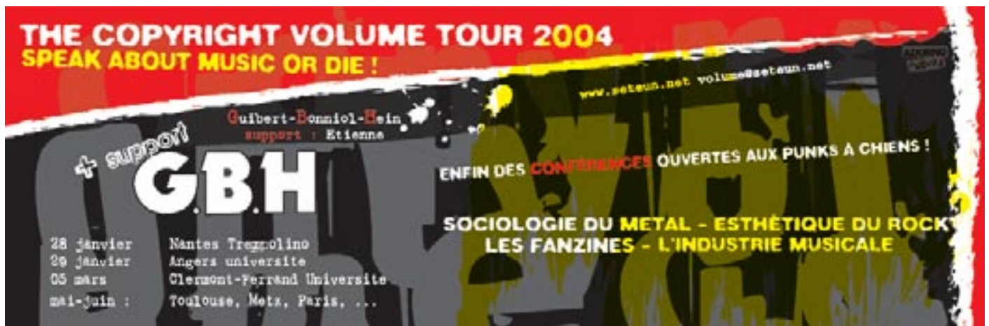
Bandeau publicitaire conçu pour le magazine Kick Ass n° 4 et le fanzine Kérosène