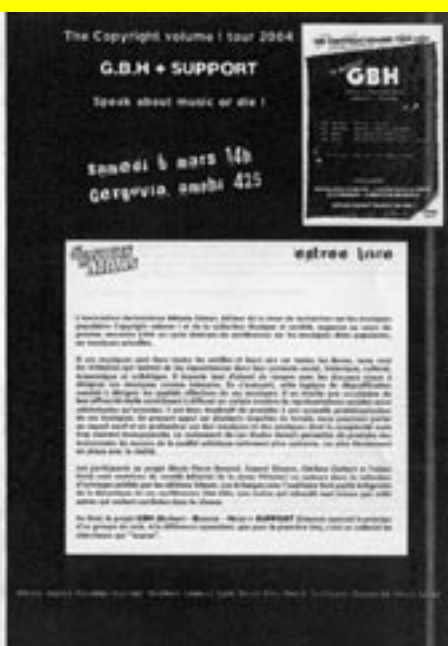
Programme 4 pages A5 NB, recto-verso, Volcaniques de Mars 2004, 150 ex.