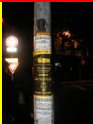
Affiche A3, recto, Besançon, 28 avril 2005,